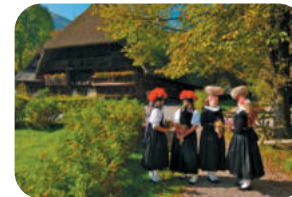
Vogtsbauernhof in Gutach